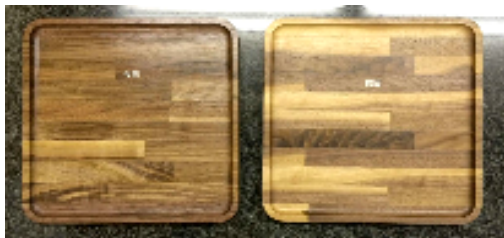
ウォールナット集成材のトレイ

また、他の樹種と組み合わせたレイヤード(右上写真)もオススメです。組み合わせのパターンによって、色合いやデザインも様々なので、オンリーワンの製品となります。